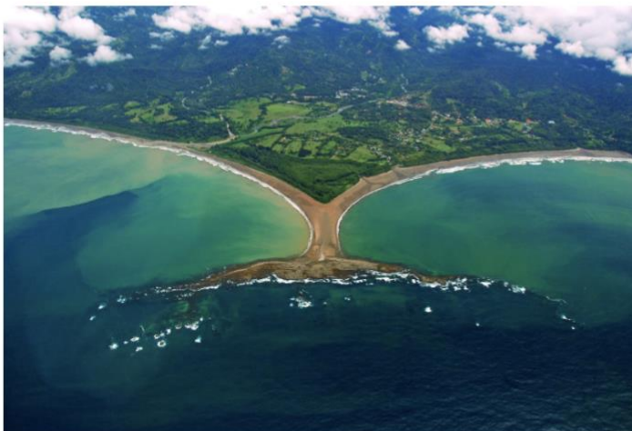
Punta Ballena, Costa Pacífica, Costa Rica.

(III CEMACYC) se realizará del 24 al 26 de noviembre del 2021, de manera virtual. Dos importantes webinarios se llevarán a cabo el 5 y 12 de noviembre, los cuales constituirán el arranque del Congreso. Este se organizará en Costa Rica.